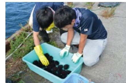
△獲れたてのウニを観察