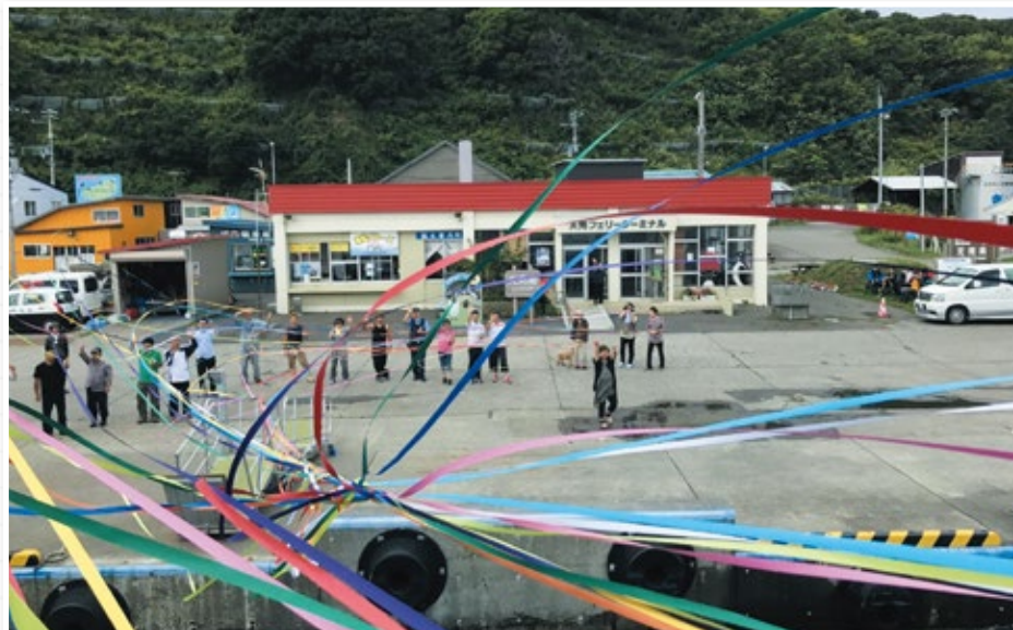
△フェリーターミナルでの見送り風景

というわけで、二年間のインタビューをこのような冊子形態でまとめることが出来ました。冊子を読んでもらった方々、どうもありがとうございます。私たちは天売島の歴史資料の少なさに着目し、読みやすく手に取ってもらいやすいものを作りました。これを通して、天売島に関心のある方を少しでも増やしていきたいと思っています。