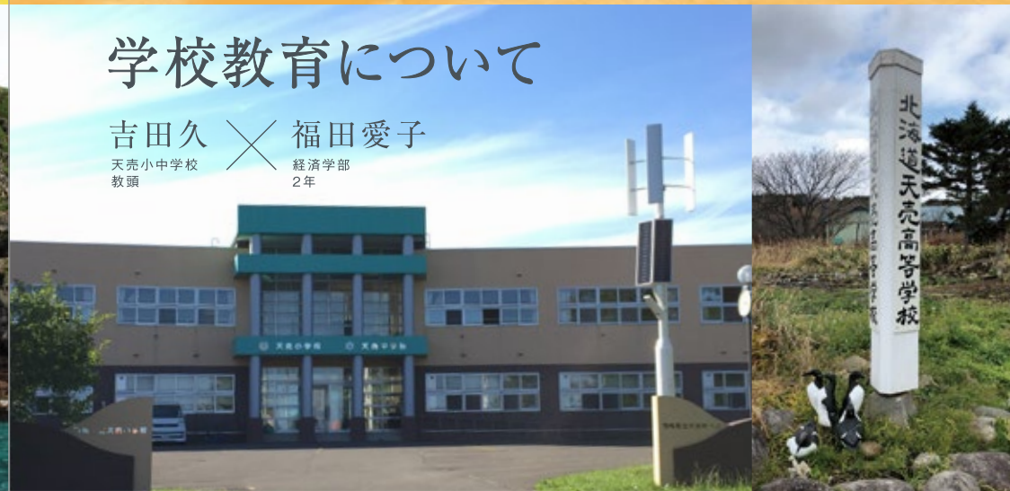
△天売小学校・天売中学校校舎