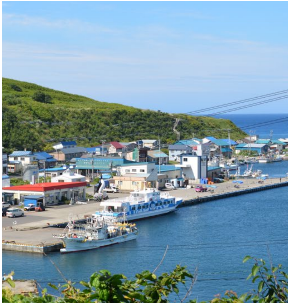
天売フェリーターミナル